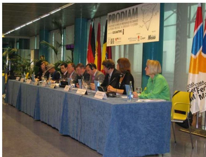
Panel de ponentes en el Acto de Apertura

PRODIAM 2008 se plantea como objetivos, analizar: