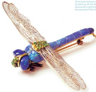
85 (left): Louis Comfort Tiffany's dragonfly brooch. The eyes and body are black opals and the delicate platinum wings have a 2 1/2-inch span. Tiffany & Co. showed the first example of this piece at the 1904 St. Louis Exposition. The Jewelry Circular described it as "a mass of rich brilliant gems. A large ruby is set in the top of the head, the back is encrusted with green garnets, the eyes are of opals, and the sections of the lower body are of carved opals" (October 26, 1904, pp. 28-29). Black opals had been discovered in Lightning Ridge, Australia, in 1902. This was one of their earliest uses in jewelry.